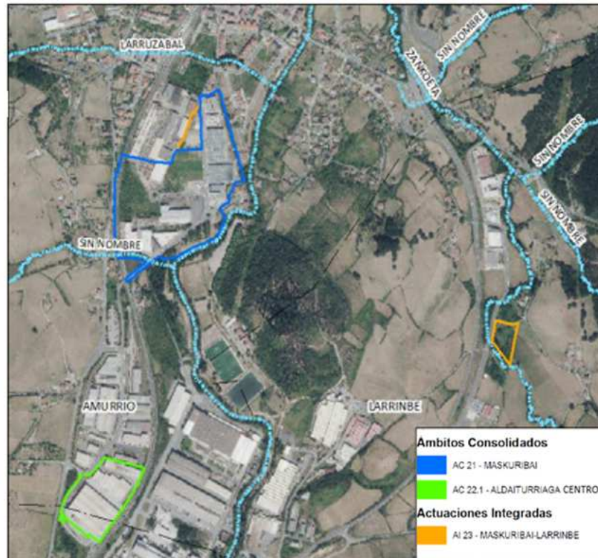
Ilustración 1.- Parcelas objeto de modificación y red hidrográfica del ámbito de estudio.

regata innominada de 0,6 Km 2 a la altura de la misma. Finalmente, en el polígono de Larrinbe, la parcela AI 23 “Maskuribai-Larrinbe” se sitúa a 10 metros del cauce en la margen derecha del arroyo Zankoeta y, por tanto, dentro de su zona de policía.